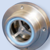
5082D Обратный клапан С - Р