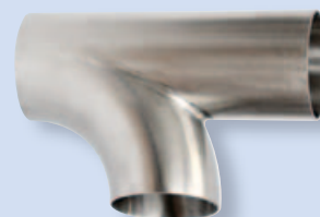
3030 Ответвительный штуцер С - С - С