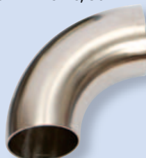
3001 Угольник С - С, 90°