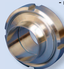
2012 Резьбовое соединение приварное - комплект