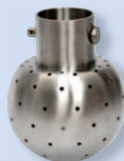
5318 Моечная головка 360°