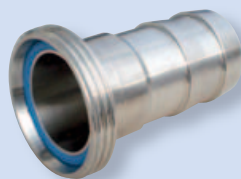
2051 Шланговая надставка - G