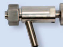
5306 Кран для отбора пробы К/М