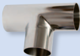
3041 Т - деталь С - С - С (длинный)