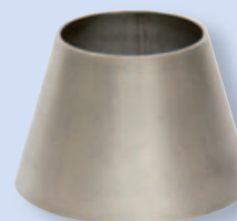
3060 Potrubní redukce