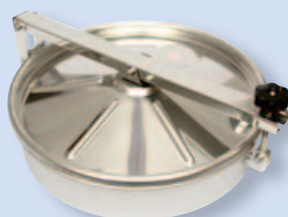
6022 Лаз кольцевой