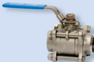
4065 Шаровой кран Р - Р (из двух частей)