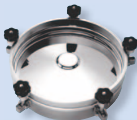
6023 Лаз кольцевой