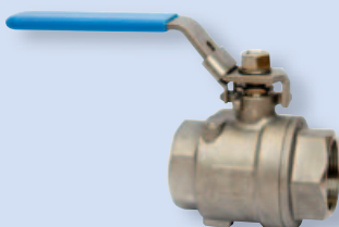
4064 Шаровой кран Р - Р (из двух частей)