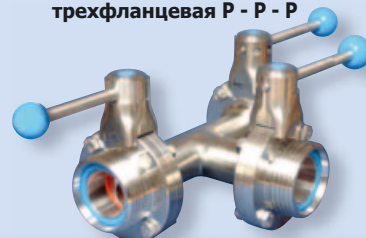
4317 Заслонка трехходовая трехфланцевая Р - Р - Р